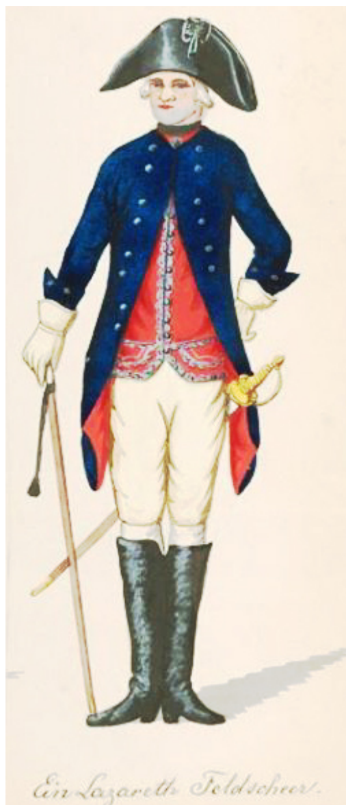
Ein Feldscher (nach dem 7. jährigen Krieg)

Der Feldscher und der ihm vorgesetzte Chirurg oder Oberchirurg trugen im Prinzip die gleiche Uniform wie die Lazarethhelfer. Als einziges „Rangzeichen“ war die rote Weste mit einer geschwungenen silbernen Borte belegt. Feldscher und Chirurg trugen Stiefel und Degen, aber kein Degen-Portepée, dass ansonsten den Offiziersrang in der preußischen