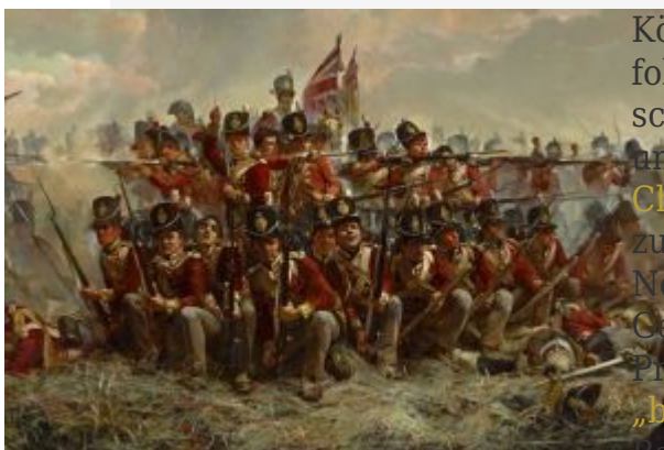
Britische Infanterie bildet bei Quatre Bras ein „bataillon carrée“