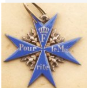
Orden „Pour le Mérite“

Bataillon im Juni 1761 Stellung vor Glogau gegenüber den Russen bezog.