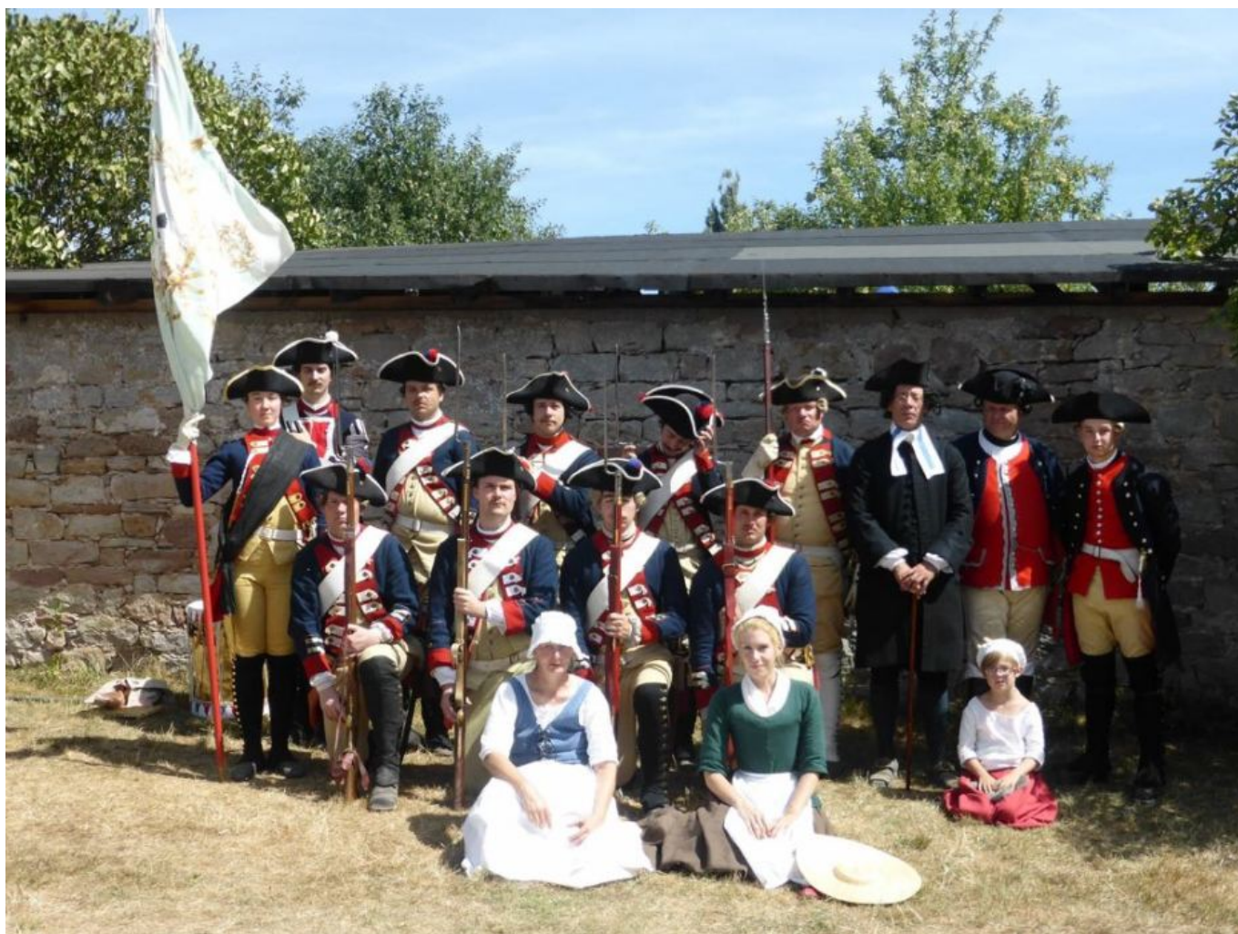
Teile des Regiments auf der Zeitreise 2018